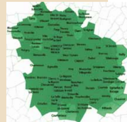
Les communes de MSL qui adhèrent au Parc Naturel :