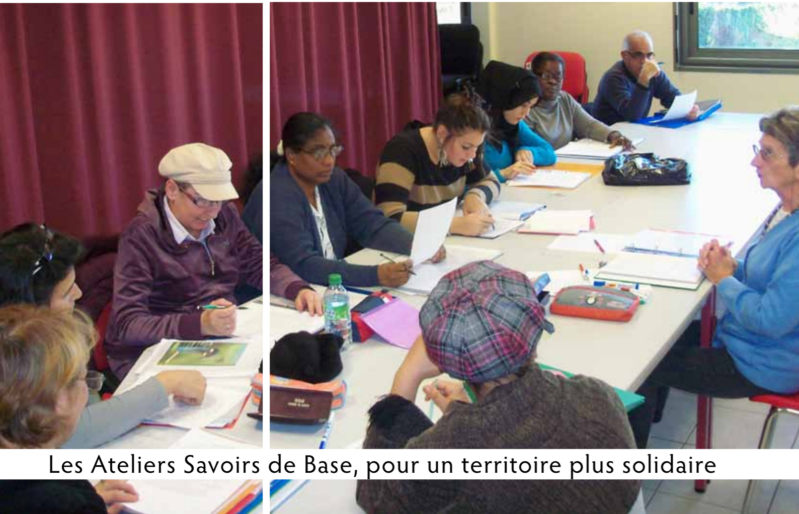
Les Ateliers Savoirs de Base, pour un territoire plus solidaire

Depuis plusieurs années, des dizaines de bénévoles offrent de leur temps pour permettre à des habitants de Moret Seine & Loing de maîtriser ou de perfectionner leur usage écrit et oral de la langue française.